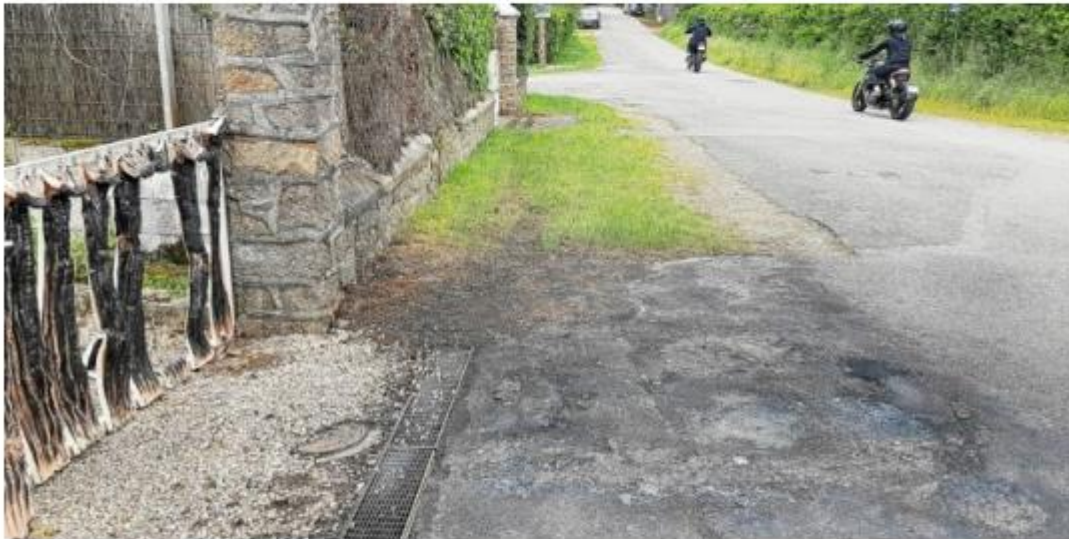
La voiture a été incendiée dans la nuit du jeudi 4 au vendredi 5 mai, sur la pointe du Cabellou à Concarneau.

Une voiture immatriculée 92 a été incendiée dans la nuit de jeudi à vendredi, à Concarneau (29), sur la pointe du Cabellou. Un tag avec le sigle « FLB », faisant référence au Front de Libération de la Bretagne, a aussi été découvert. Dépitée, la propriétaire rappelle qu'elle est d'origine bretonne.