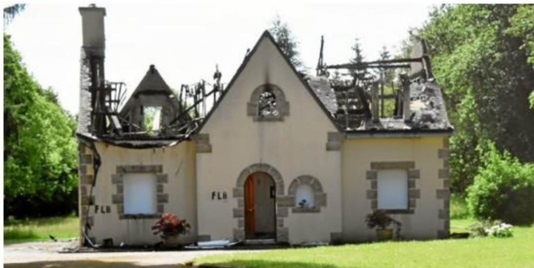
Cette résidence secondaire de Caurel (22) a été détruite par un incendie criminel. Sur la façade, figurent deux inscriptions « FLB ».

Publié par Jacques Chanteau le 09 mai 2023 à 17h00