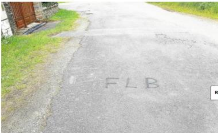
Le tag « FLB » a été inscrit sur la route à côté de l'incendie de la voiture, au Cabellou.